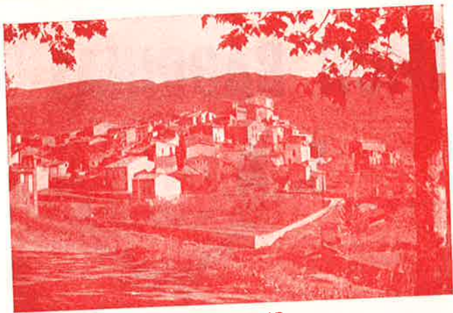
VISTA PARCIAL DEL POBLE