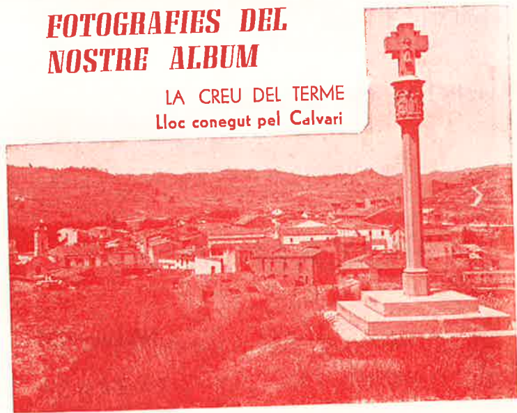
LA CREU DEL TERME Lloc conegut pel Calvari

MEDIDA Y ALTA CONFECCION SEÑORA, CABALLERO Y NIÑO