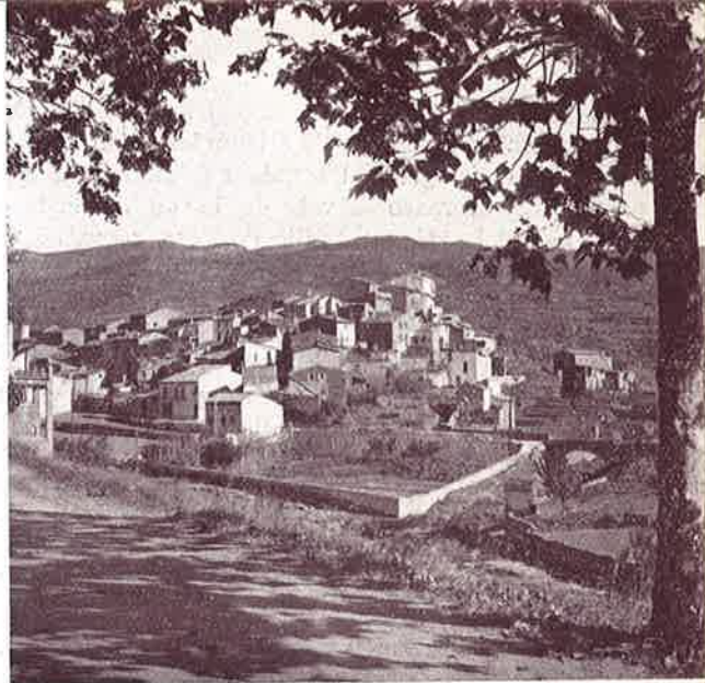
Pintoresca vista parcial

con los términos de Talamanca, Castelltersol y Granera. Al Este, con San Quírico Safaja y Gallifa, al Sur, con los de Castellar del Vallés y, al Oeste, con los de Rellinás y Mura.