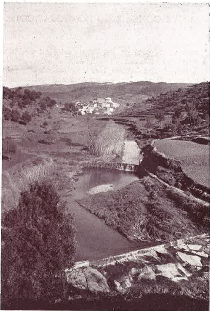
Bellísimo paisaje del Río Ripoll en los alrededores de San Lorenzo Savall