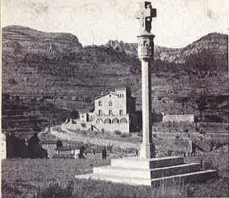
Cruz del Calvario (En el fondo el Montcau)

El 6 de abril próximo pasado, en esta villa Lorenzana, tuvo lugar un homenaje al hijo dilecto, Rvdo. D. Miguel Rosell Galí, Presbítero, con motivo de habersele otorgado por el Excelentísimo señor Ministro de Justicia, don Antonio Iturmendi, la Cruz Distinguida de Primera clase de San Raimundo de Peñafort, y, para dar más realce el acto de la imposición, tuvieron lugar los Primeros Juegos Flarales de Primavera del Alto Vallés, celebrándose en la Plaza Mayor de la villa. En este certamen fueron presentados unos 300 trabajos, en verso y prosa, por escritores de toda la península.