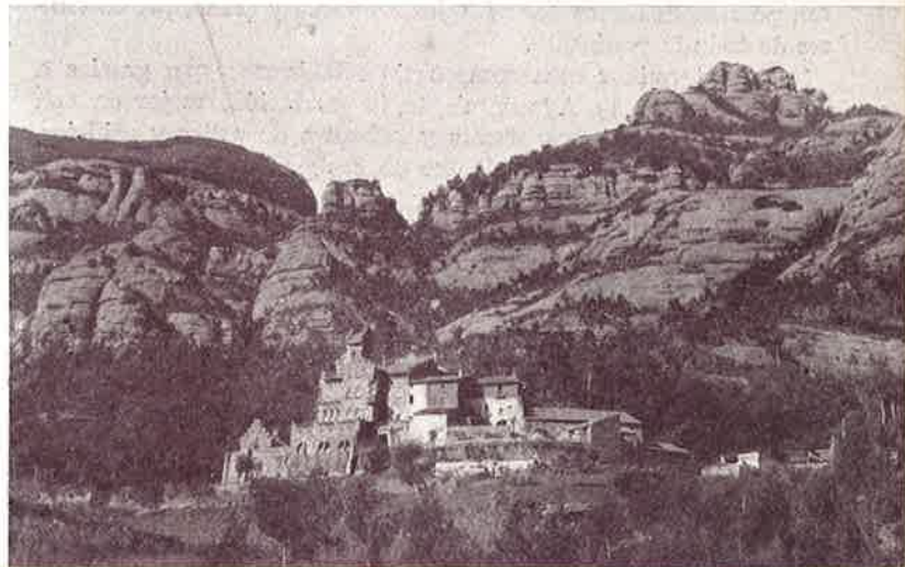
Maravilloso paisaje del Marquet de las Rocas

San Lorenzo Savall, creciendo paulatinamente, siente la inquietud y el afán de las cosas que elevan la cultura de un pueblo. Esta villa, pródiga en vocaciones para el sacerdocio, tiene una larga lista de tales, nacidos en ella, que no todos los pueblos de su categoría pueden ostentar. Entre sus más privilegiados hijos que han conseguido renombre por su inteligencia y bondad vamos a nombrar algunos, quizás ofendiendo su modestia: el Rdo. Fra. Matías Solá Farell consagrado Obispo de Colofón el 22 de abril de 1931. En una de las calles de la población que ostenta su nombre, hay la casa donde nació tan preclaro hijo de la villa y hoy estimado por sus muchas visitas y por asistir presidiendo infinidad de actos religiosos en la provincia de Barcelona.