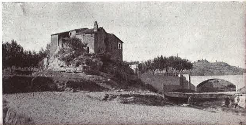
Típica vista del «Pont Farré»

San Lorenzo Savall es una de las poblaciones que todavía conserva aquella calma y aquel regusto de cosa típica y añorana, que muchos hoy añoran en las grandes y modernas ciudades. El pasear por sus calles, uno, puede admirar los escudos heráldicos de la nobleza antigua que se conservan en muchas de las fachadas de sus casas y algunas ventanitas de estilo gótico; el conjunto armonioso de su plaza mayor, junto a la Iglesia Parroquial; sus industrias y comercios dignos de toda población laboriosa; el tipismo de sus calles tortuosas y algunas escalo-